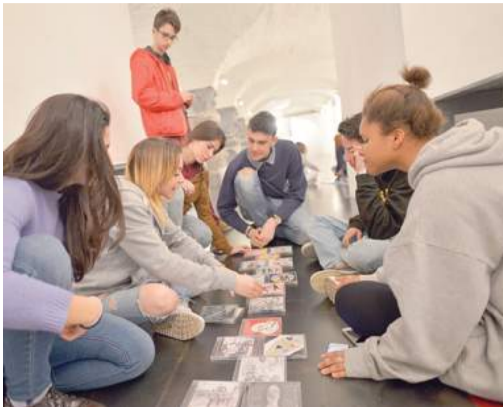
Studenti del Liceo Artistico Paul Klee di Genova al lavoro

della cultura di massa e vera e propria industria culturale, forse un tempo più redditizia di oggi. Si è voluto restringere l'arco di tempo, scegliendo la musica del secolo breve. Ad ogni classe è stato affidato un periodo, all'interno del quale gli alunni hanno scelto le 10 canzoni per loro più rappresentative, realizzandone una nuova custodia. Dall'ascolto musicale dovevano arrivare le suggestioni per le copertine, da esporre secondo una linea temporale