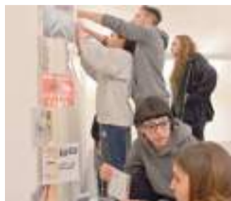
L'allestimento della mostra

La scelta, anche su suggerimento di Arienti, è caduta sulla musica pop, come una delle più tipiche espressioni